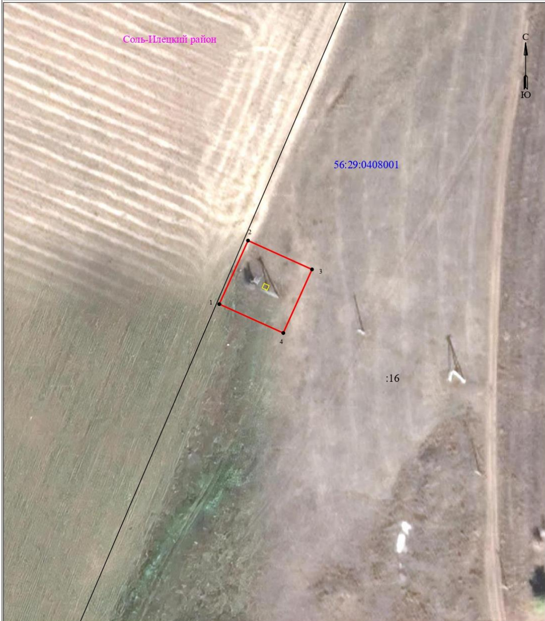
Схема расположения границ публичного сервитута для эксплуатации объекта ТП-17 Л-10 кВ Чш-7 ПС Чашкан 110/10 кВ